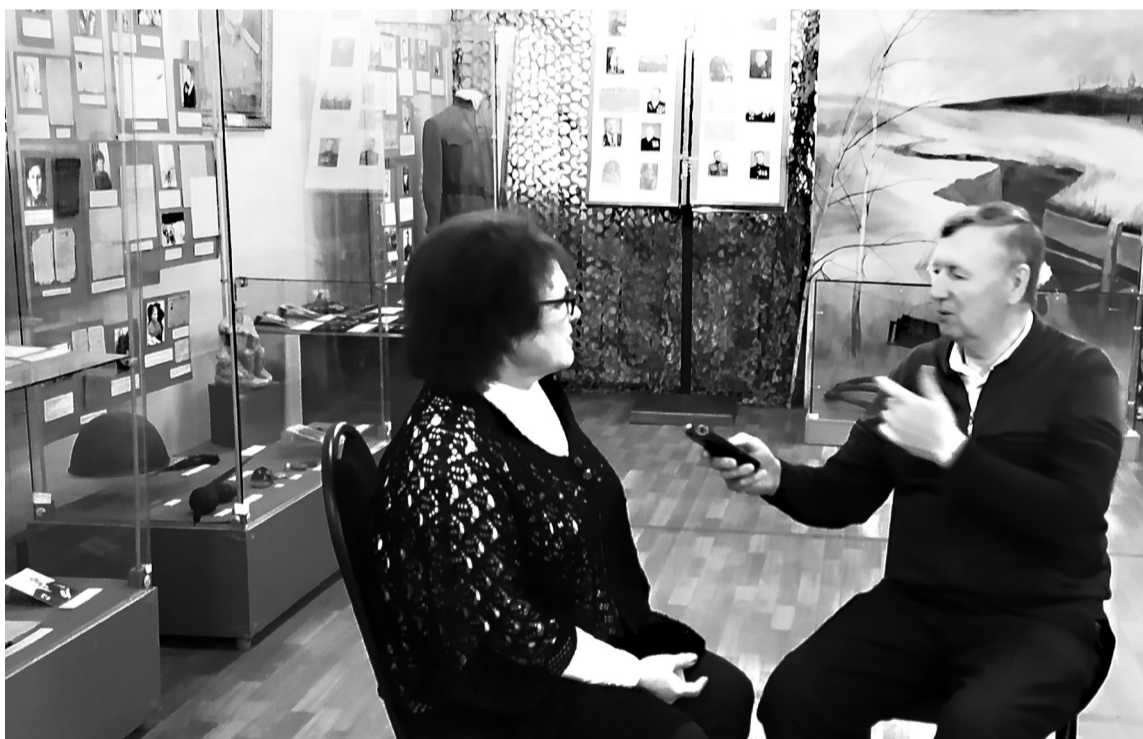
Интервью радио ГТРК Саратов. Программа "От Хопра до Иргиза. Точка на карте губернии".