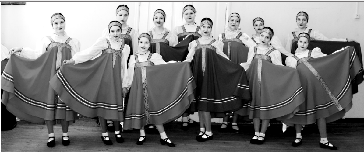
Ансамбль народного танца «Радуга».