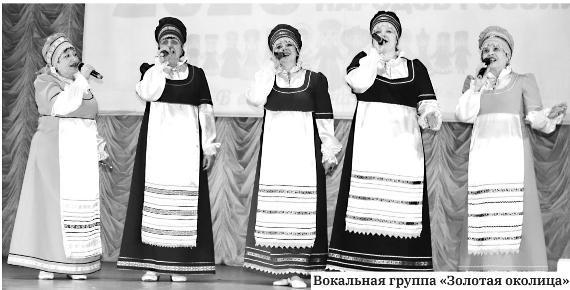
Вокальная группа «Золотая околица»