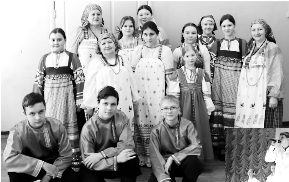
Участники фольклорного отделения ДШИ и фольклорной группы «Любава».

Концертные номера в исполнении участников ансамбля народного танца «Радуга» и фольклорной