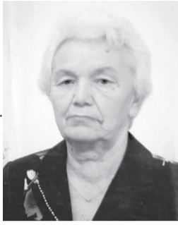
Дочери, внуки, правнук.

Твою безусловную любовь, Твои советы. Твою помощь. Твою заботу. Твое терпение. Твою защиту. Твои объятия. Твоё прекрасное сердце. Твою мудрость. Твою доброту. Твою поддержку. Твой успокаивающий голос. Твою способность создавать лучшие воспоминания. Но, больше всего Мы благодарим тебя за то, Что ты есть у нас!