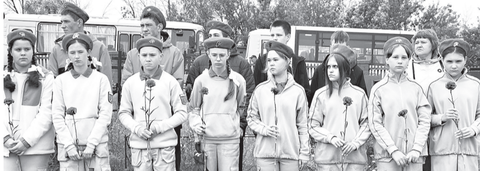
Юнармейцы СОШ №1.