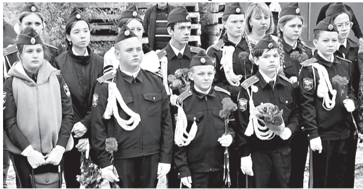
Кадеты СОШ №2.

Минутой молчания участники митинга почтили память всех, кто не вернулся с самой кровопролитной