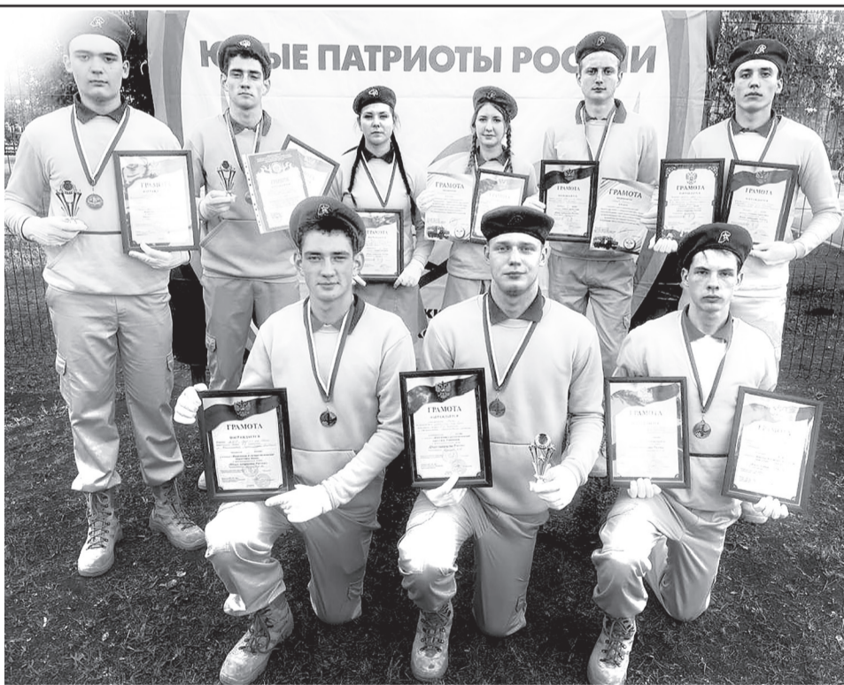
Победители слёта – команда средней школы №1.