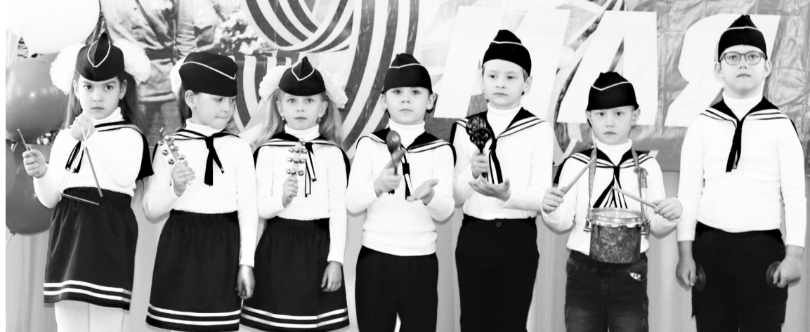
Шумовой ансамбль д/с «Почемучка».