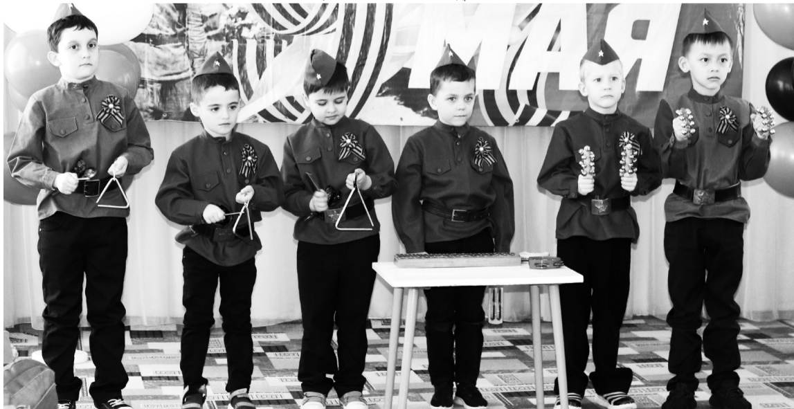
Шумовой ансамбль мальчиков д/с №10.

ком, грандиозном празднике. Следует сказать огромное спасибо всем музыкальным руководителям, педагогам за любовь к детям, за проводимую на высоком уровне воспитательную работу в дошкольных образовательных учреждениях, за открытие талантов в малышах и развитие их способностей.