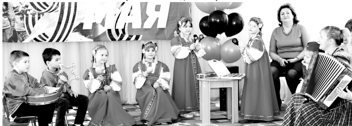
Ансамбль «Комарики» д/с №2.