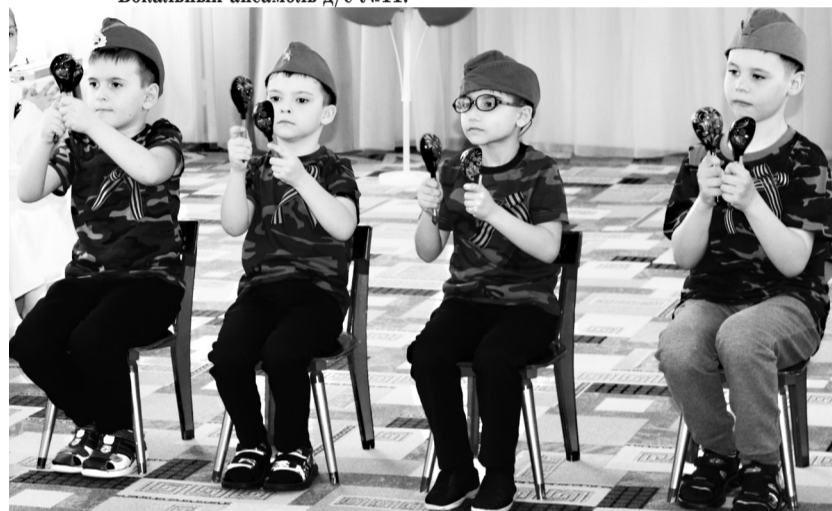
Ложки д/с №12.