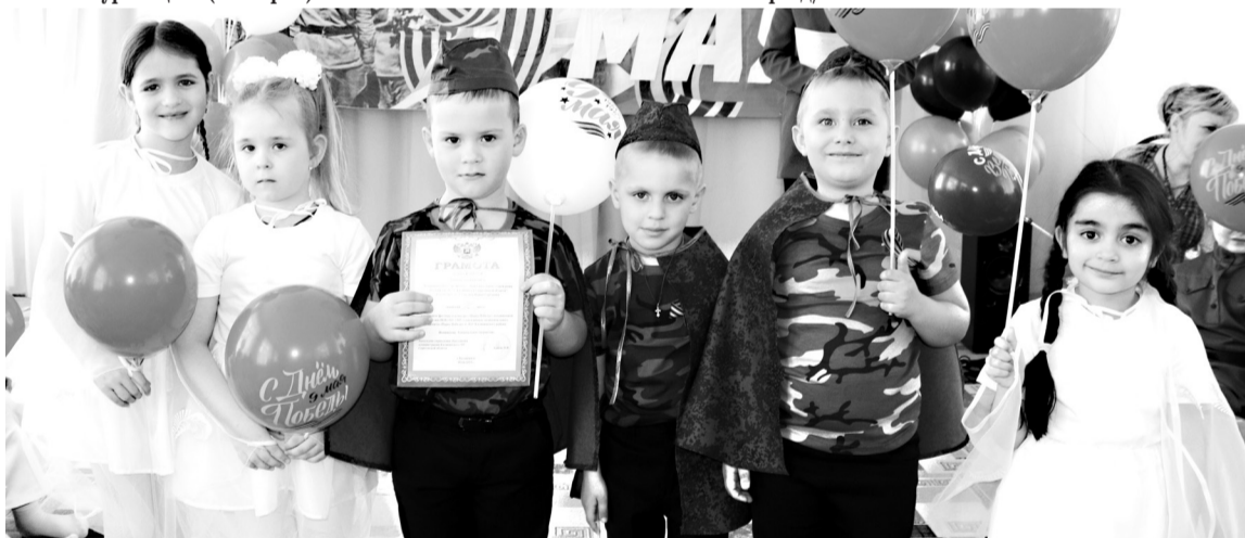
Танцевальный ансамбль д/с №7.