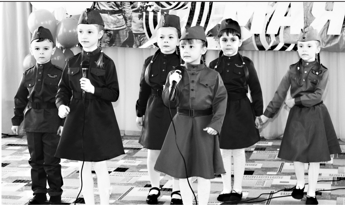
Вокальный ансамбль д/с №11.

Дети с гордостью принимали из рук председателя жюри Грамоты, с удовольствием фотографировались и не скрывали своей искренней радости от участия в этом яр-