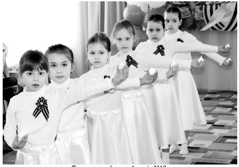
Танцевальный ансамбль д/с №10.