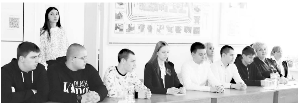
Участники «круглого стола».