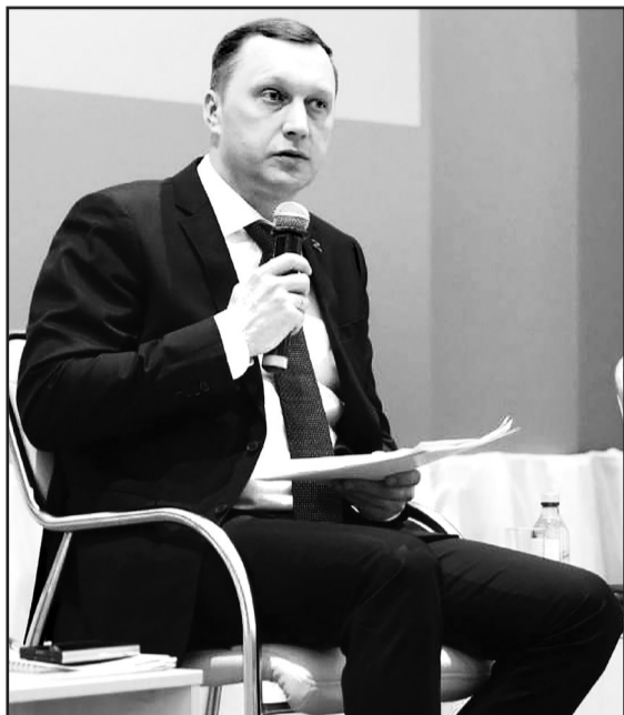
Губернатор Саратовской области Роман БУСАРГИН принял участие в заседании коллегии министерства здравоохранения.

2023 году. Благодаря решениям Президента Владимира Путина закупается современное медицинское оборудование, в том числе узкопрофильное и дорогостоящее, – отметил глава региона.