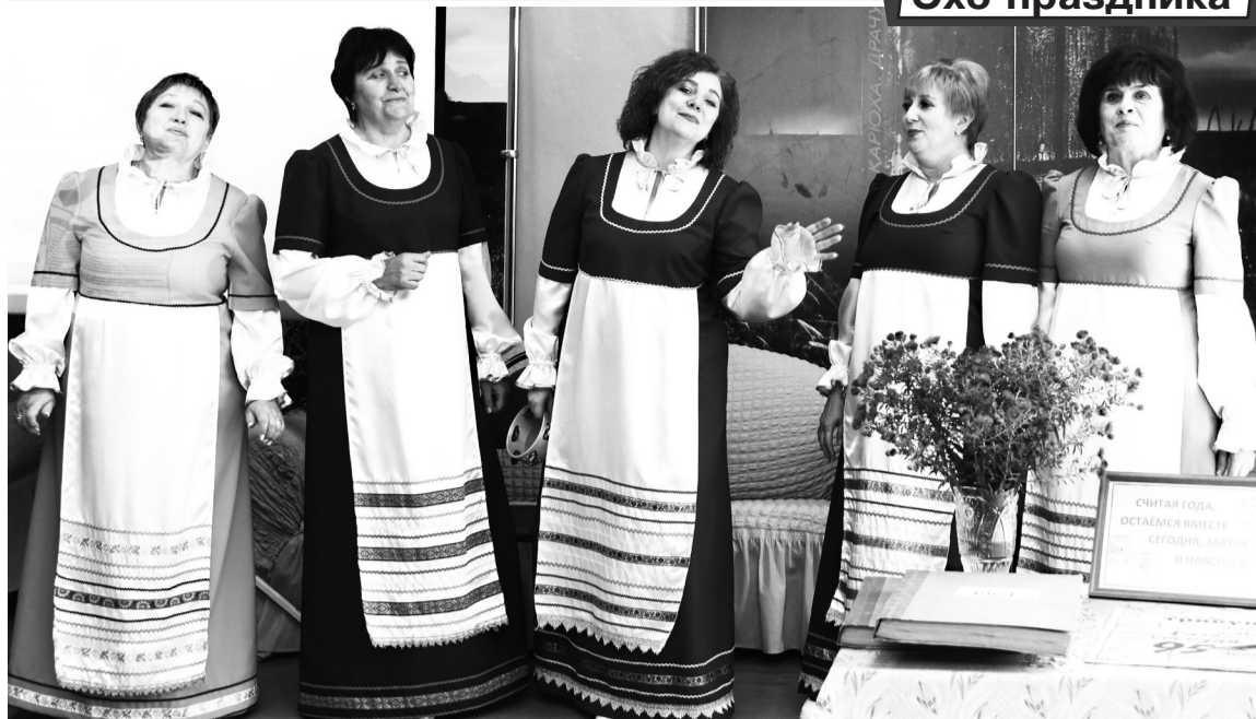
Вокальная группа «Золотая околица».